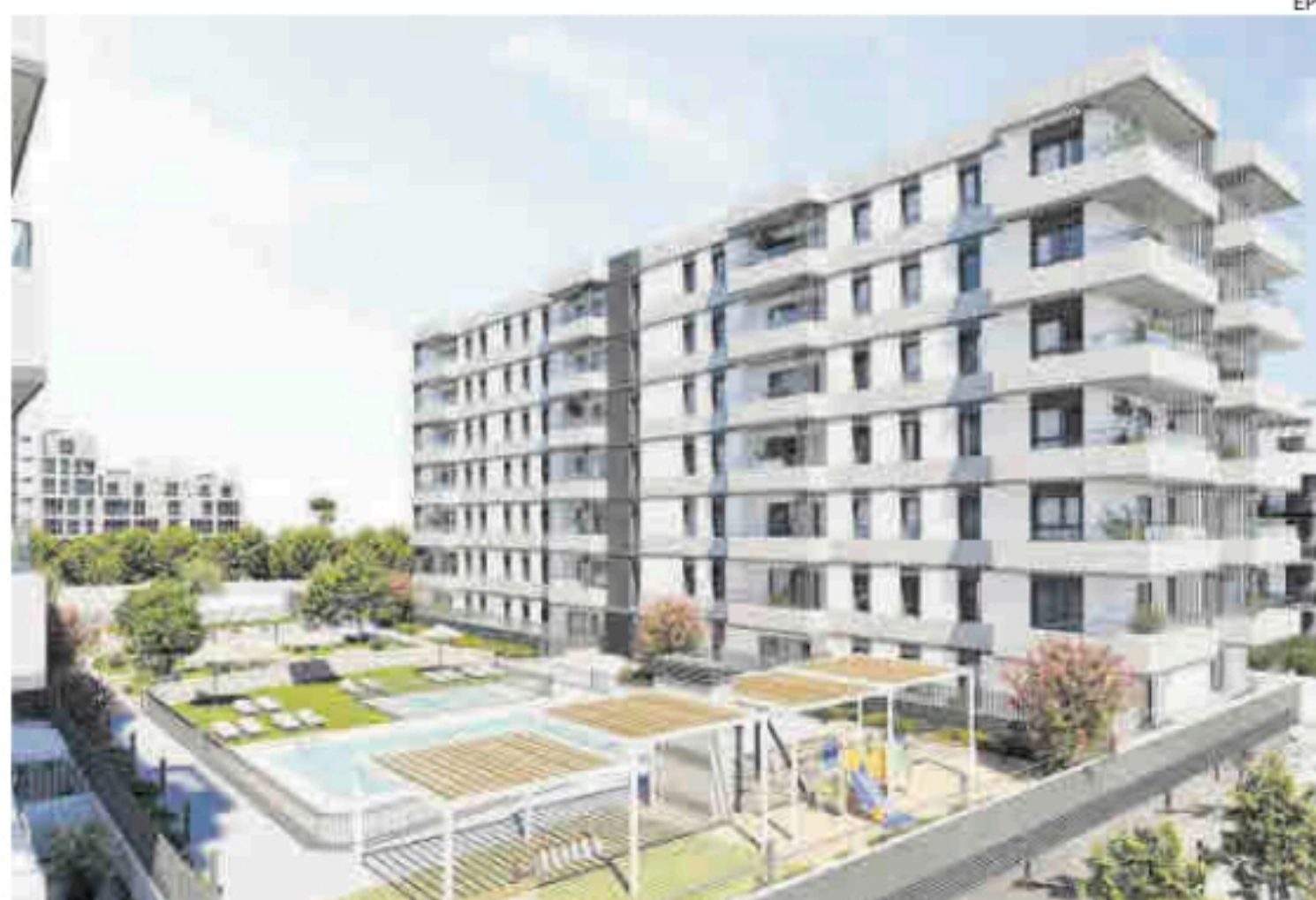
Recreación de una promoción de Aedas Homes en la ciudad de Málaga.

En total, las cinco compañías promotoras, cuyo negocio es la compra de un terreno, diseño de una promoción de viviendas y su posterior venta, tienen un banco de