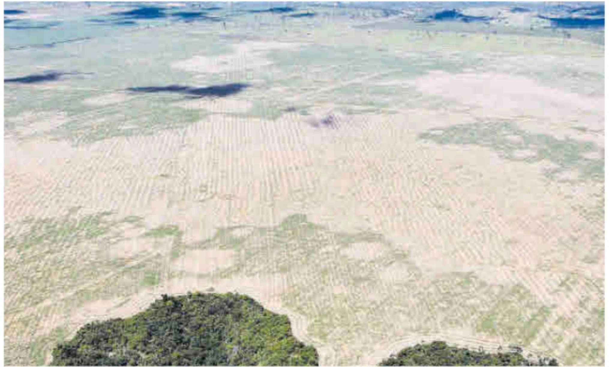
La deforestación avanza imparable en numerosos enclaves del planeta.