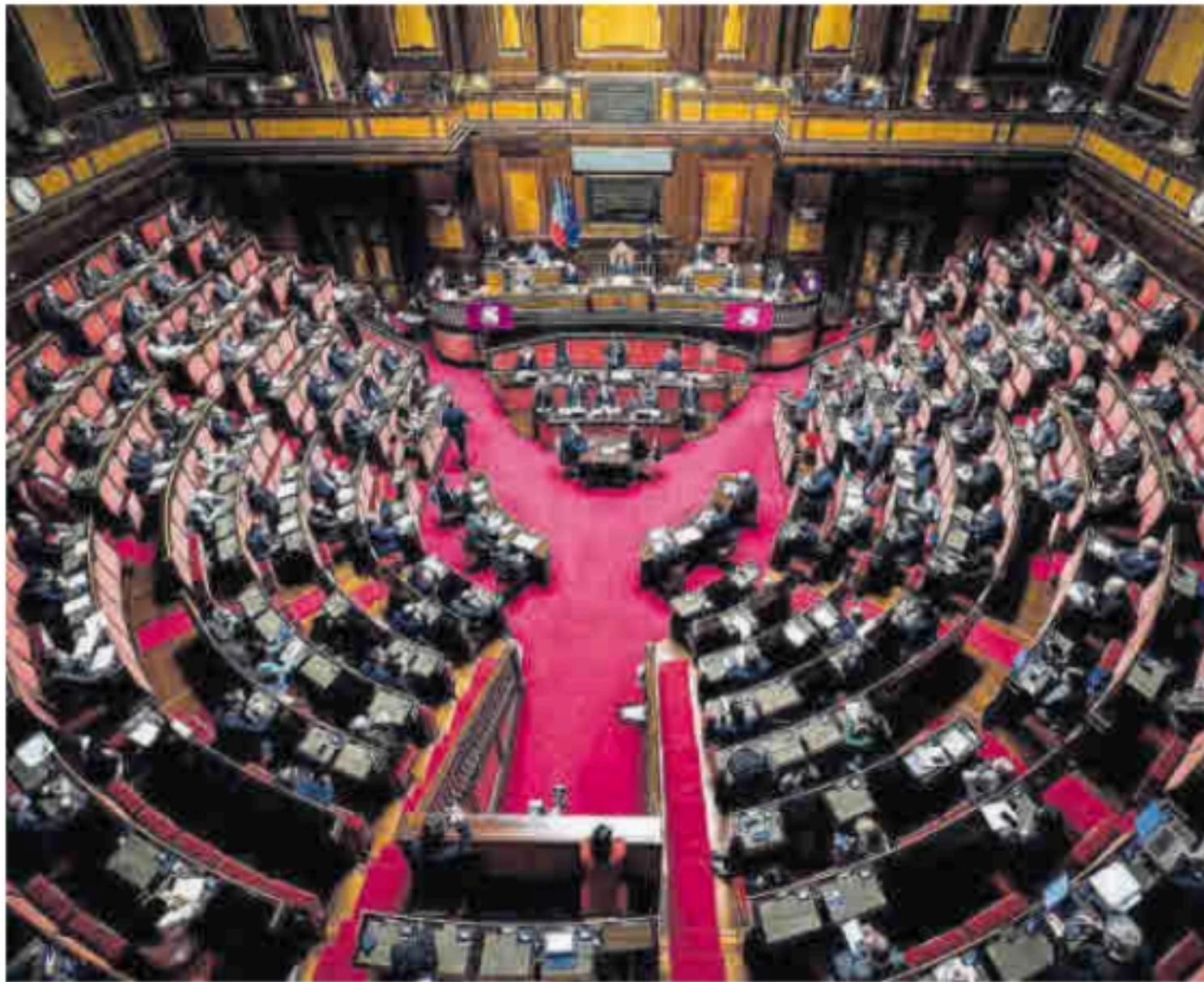
Una sesión del Senado italiano, en el Palazzo Giustiniano de Roma.