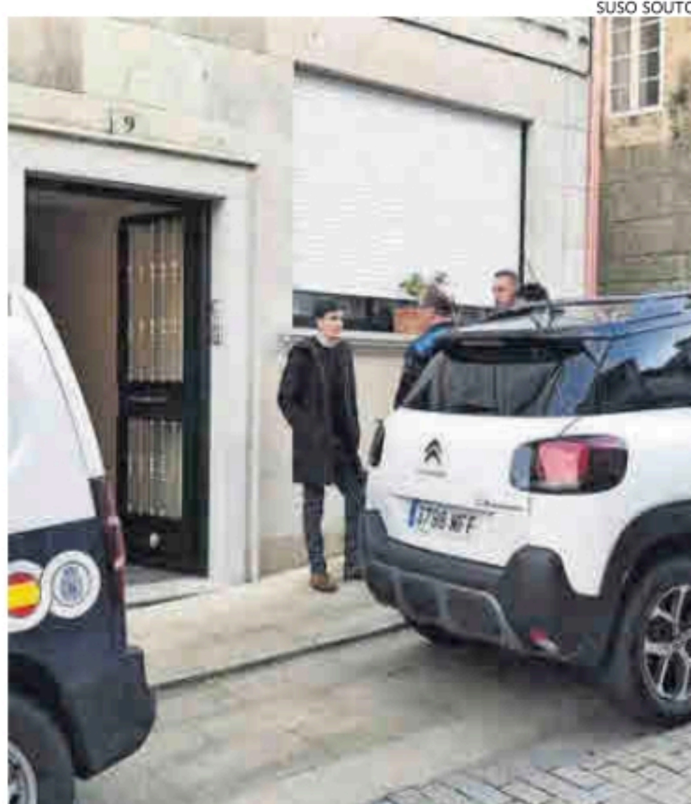
El alcalde de Ribeira frente al domicilio donde se produjo el crimen.

Cuando los equipos sanitarios y la Policía Nacional llegaron al inmueble, el hombre presentaba heridas graves que, presuntamente, él mismo se autoinfligió con el arma blanca con la que acabó con la vida de su pareja. Tras ser estabilizado, fue trasladado en ambulancia al hospital de Barbanza en estado grave.