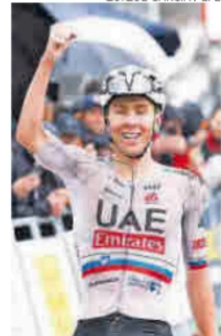
Pogacar celebra su triunfo, ayer.