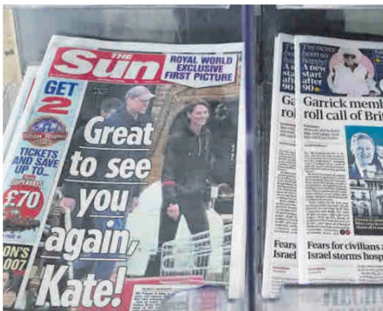
La portada de 'The Sun' con la imagen de la princesa de Gales, ayer en un quiosco.

El palacio de Kensington, encargado de gestionar la agenda de los príncipes de Gales, ha insistido desde el principio en la volun-