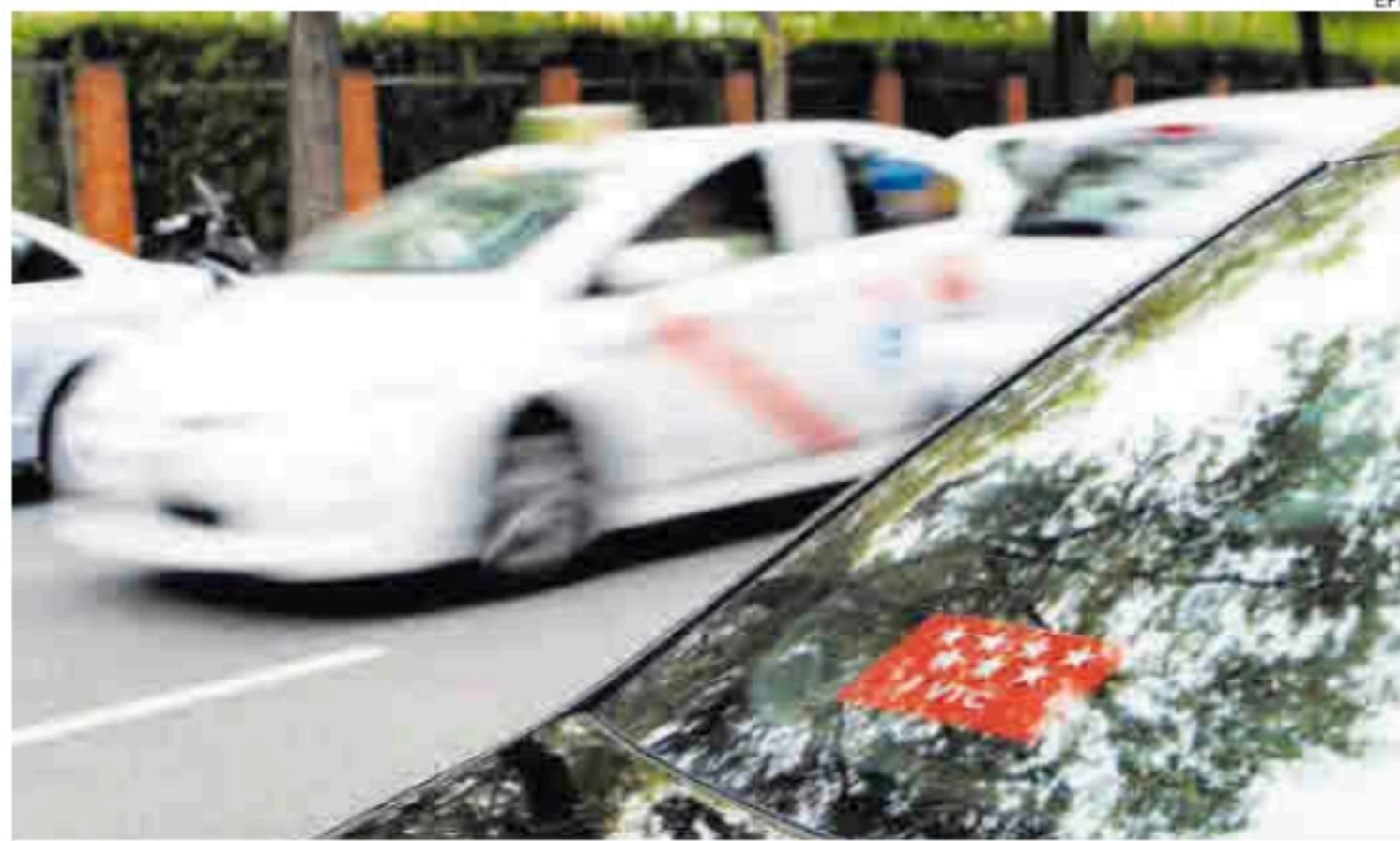
Un taxi pasa junto a un vehículo VTC en una calle del centro de Madrid.

examen salvo que a 1 de enero de 2024 «vinieran ejerciendo la conducción de vehículos de arrendamiento con conductor durante al menos un año de forma ininterrumpida, o dos en el período de los cuatro años anteriores».