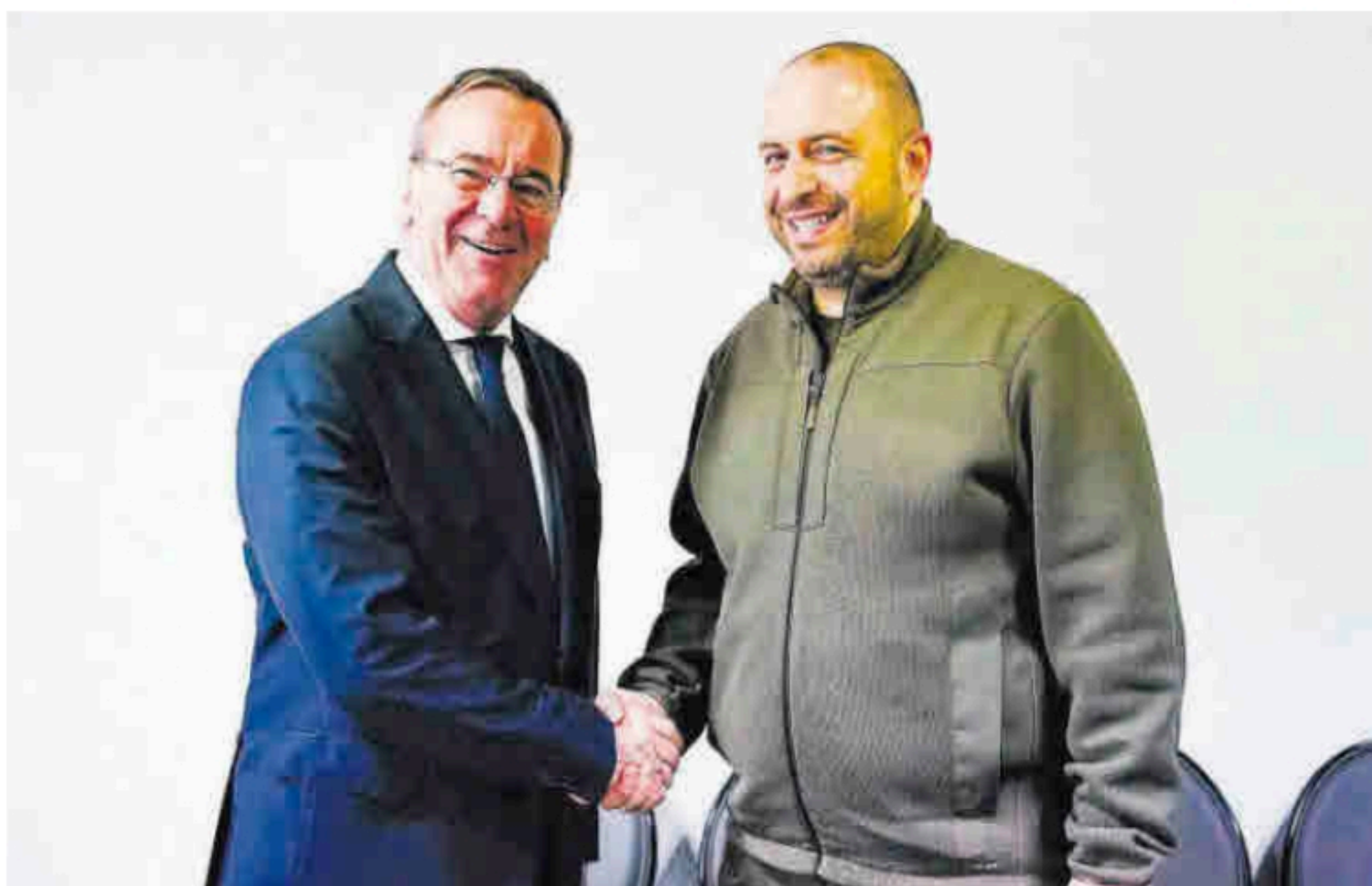
Boris Pistorius, ministro de Defensa alemán, con su homólogo ucraniano Rustem Umjerow, ayer en la base estadounidense de Ramstein.

También se ha materializado otra coalición de 14 países, encabezada por Finlandia y con Alemania, Dinamarca, Polonia y los estados bálticos entre ellos, que ha pedido al Banco Europeo de Inversiones (BEI) que incremente el apoyo a la industria europea de Defensa. El contexto es la necesidad de aumentar la producción destinada a Ucrania, así como la del propio bloque comunitario. Especialmente entre los