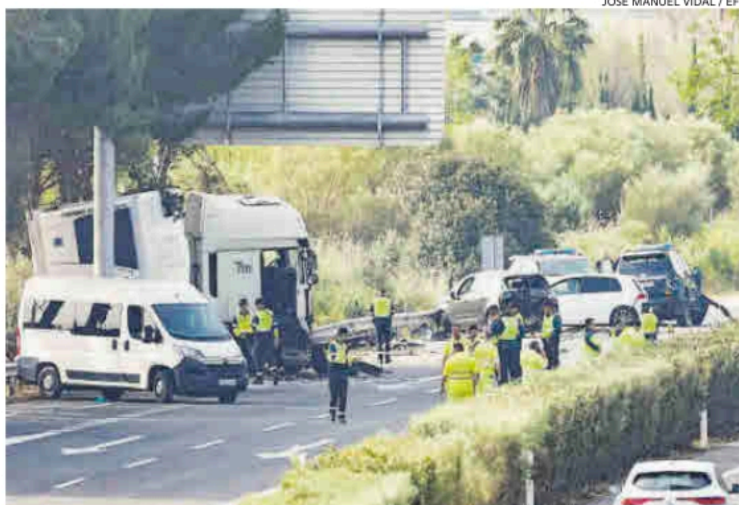
Agentes de la Guardia Civil, en el lugar del accidente en la AP-4, a la altura de Los Palacios y Villafranca (Sevilla).

Tras el suceso, un juzgado de instrucción de Utrera (Sevilla) ha ordenado el ingreso en prisión del conductor del camión, acusado de seis presuntos delitos de homicidio por imprudencia y tres delitos de lesiones graves por imprudencia.