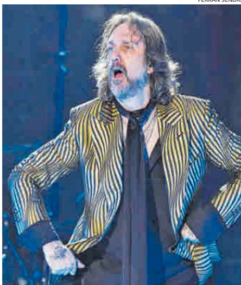
Chris Robinson, durante un concierto en Barcelona.

autosabotaje. El álbum está resuelto con pegada desde el tema de apertura, Beside Manners , con su riff con slide guitar , el piano de cantina y los coros humeantes.