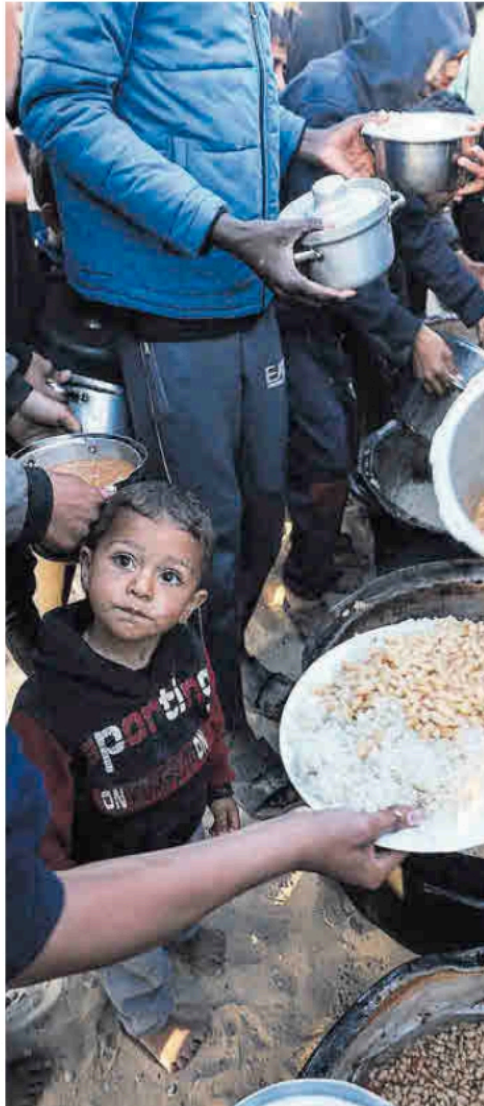
Desplazados palestinos en Rafah, el pasado 11 de marzo.

Menos publicidad ha conseguido el puente aéreo que ha funcionado de manera constante para