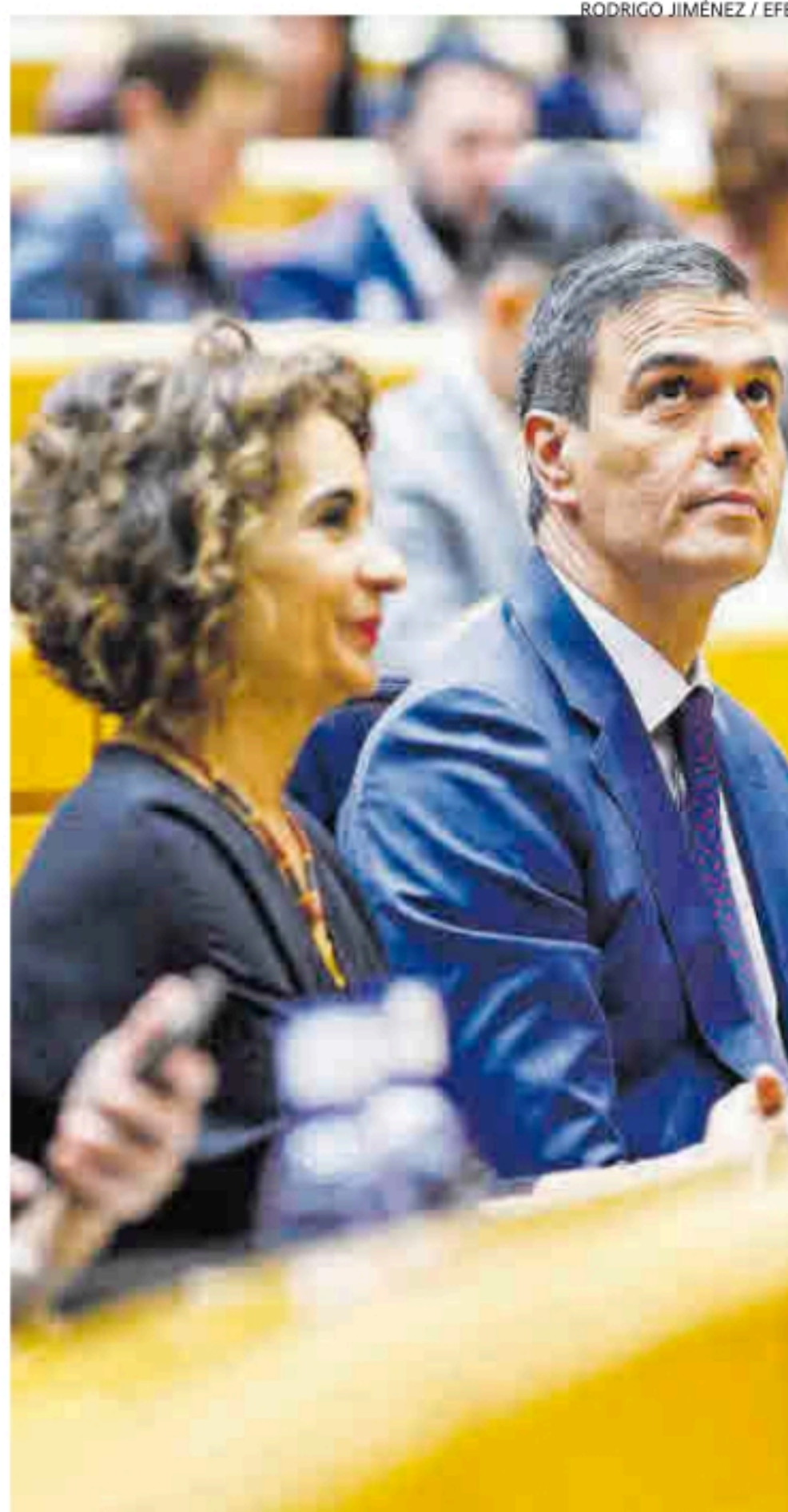
Pedro Sánchez y María Jesús Montero, en un pleno en el Senado.

El proyecto, eso sí, afronta una fortísima oposición por parte del sector financiero, además de no entusiasmar a los organismos supervisores. La Autoridad de Defensa del Cliente Financiero, de ser aprobada, será un nuevo organismo que asumirá la resolución administrativa de las reclamaciones que presentan los clientes ante bancos, aseguradoras y firmas de inversión. ■