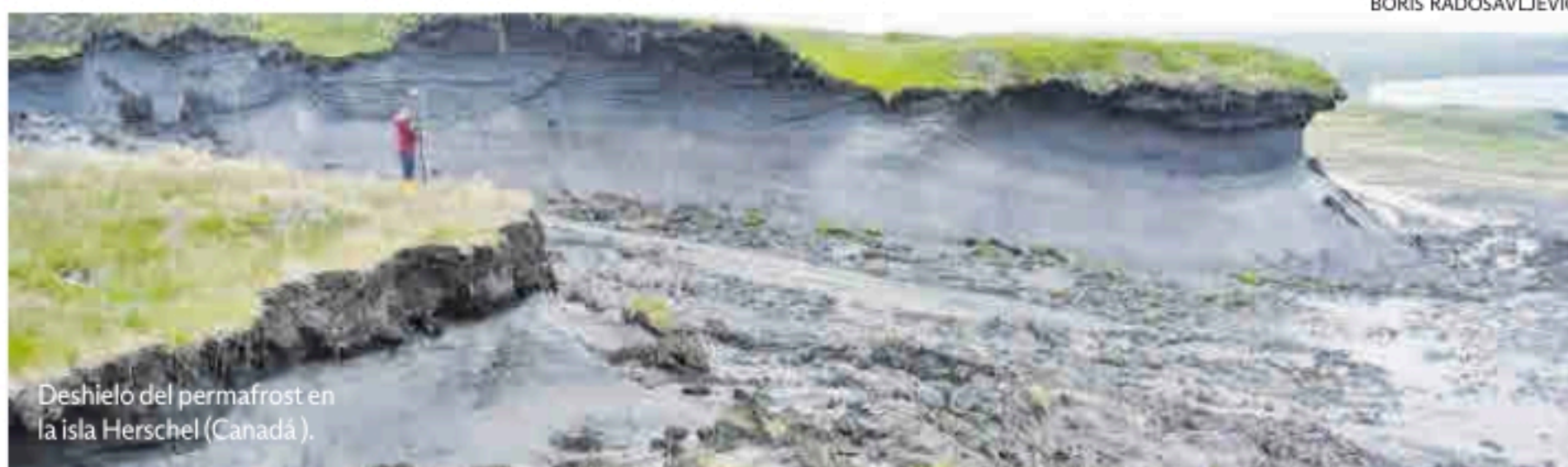
Deshielo del permafrost en la isla Herschel (Canadá).

cionados con el impacto de extremos climáticos como, por ejemplo, la reconstrucción de ciudades destruidas por un temporal o una inundación extrema o, sin ir más lejos, las medidas extraordinarias que se tienen que tomar para conseguir agua en territorios afectados. El año pasado, el paso del huracán Otis por México causó casi 50 muertes y pérdidas equivalentes a 15.000 millones de dólares. Los incendios de Hawái, por su parte, le costaron la vida a un centenar de personas y causaron pérdidas de más de 5.600 millones de dólares. ■