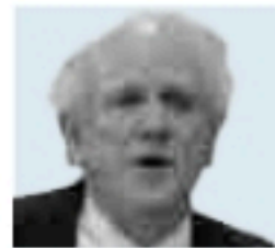
LA VENTANA LATINOAMERICANA CARLOS MALAMUD

El fracaso de la comunidad internacional en su empeño de resolver la crisis es evidente, así como también el escaso o nulo compromiso de la mayoría de los países latinoamericanos