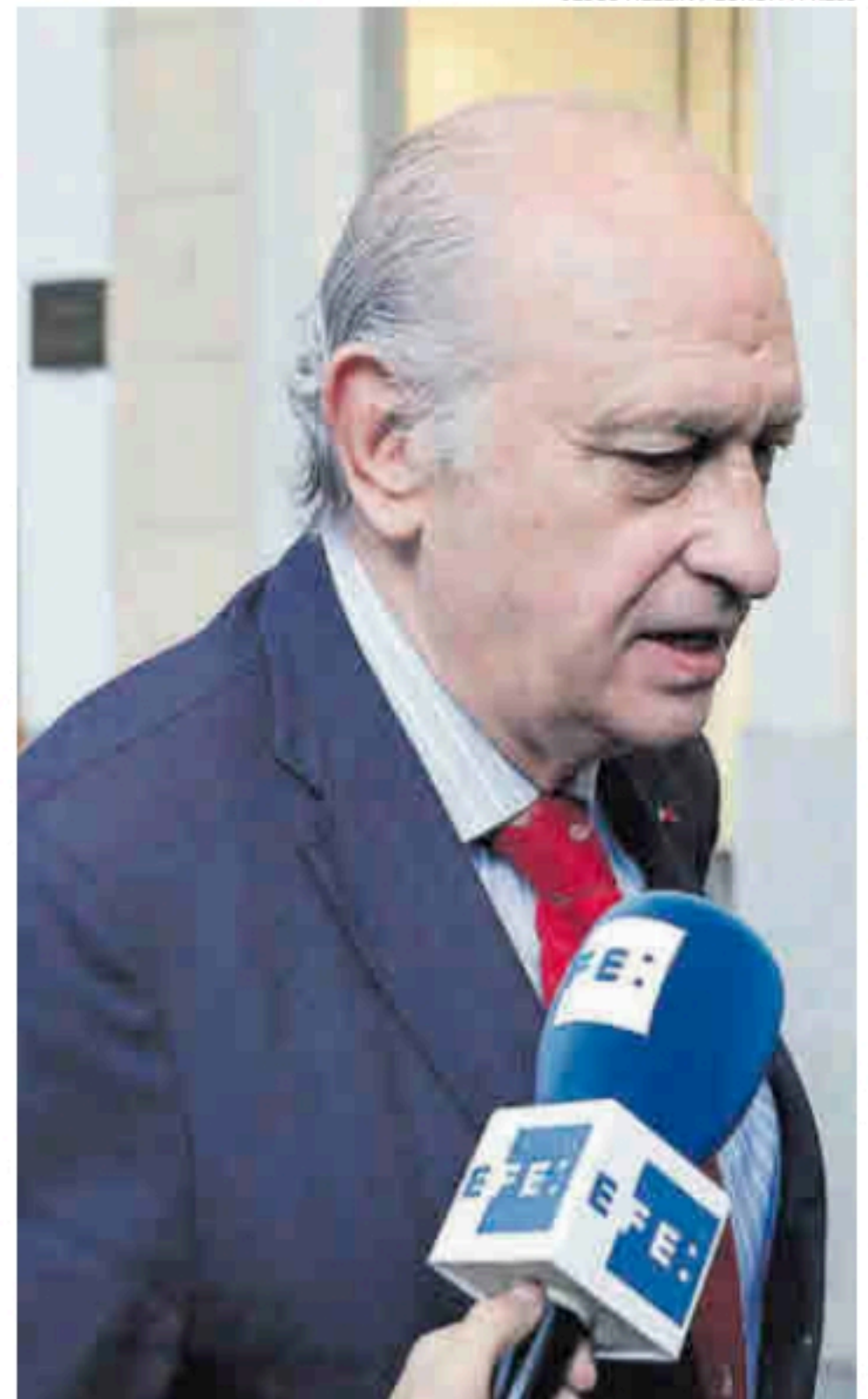
El exministro de Interior del PP, Fernández Díaz, en una imagen de 2019.

Esta forma de actuar de García Castellón, lamenta el escrito de defensa de Fernández Díaz, «es ajena a toda lógica», al mismo tiempo que es «contradictoria con el resultado de las diligencias practicadas». Al mismo tiempo, ha «perjudicado gravemente ya (antes del juicio)» a su cliente, «quien se verá sometido a una pena de banquillo y telediarario tan