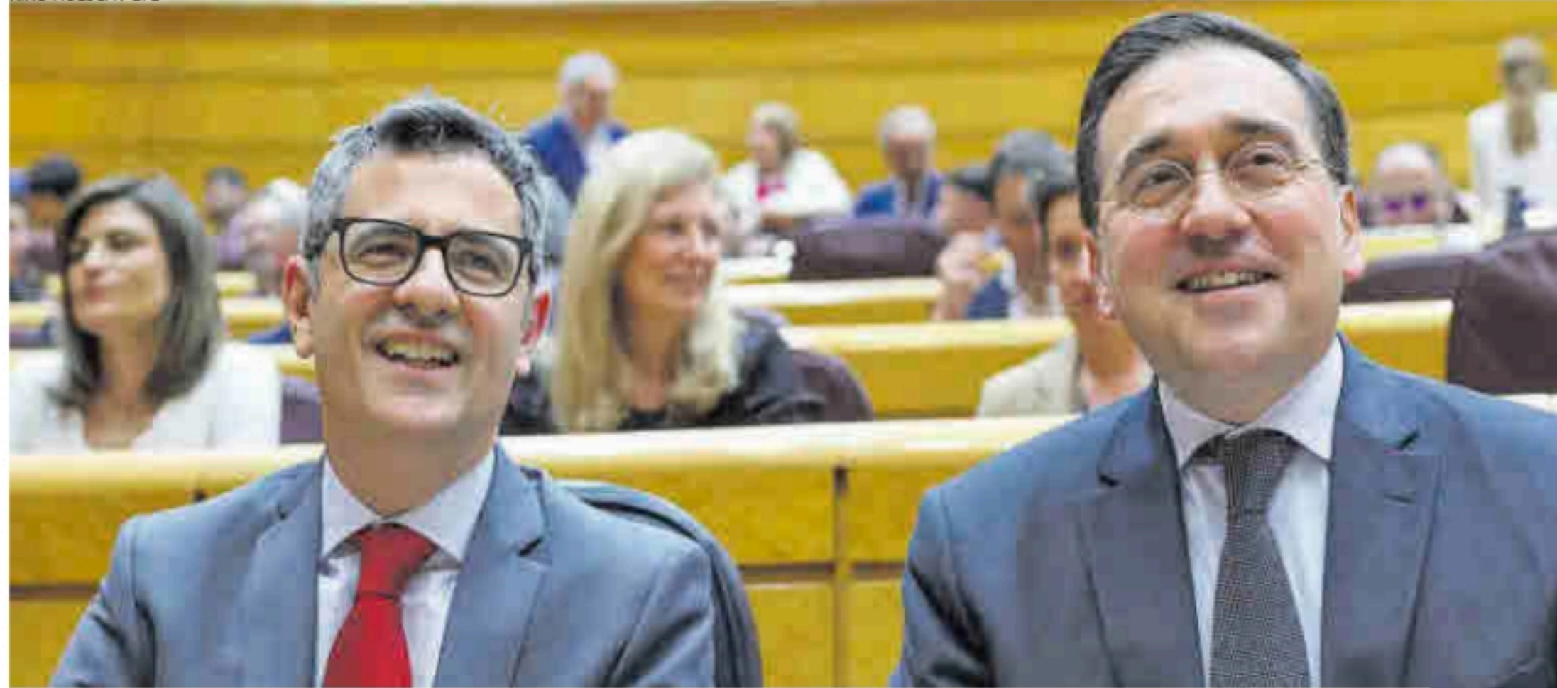
Los ministros de Presidencia y de Exteriores, Félix Bolaños y José Manuel Albares, ayer en el Senado.