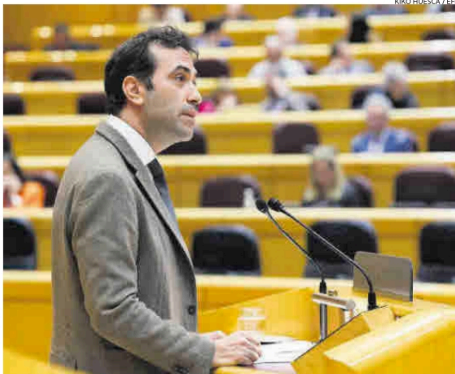
El ministro de Economía, Carlos Cuerpo, interviene en la sesión de control al Gobierno, ayer en el Senado.

La incertidumbre sobre la política económica, recordó, se ha convertido en la principal preocupación de las empresas españolas en los últimos trimestres, un 58% de ellas dicen verse afectadas por la misma.